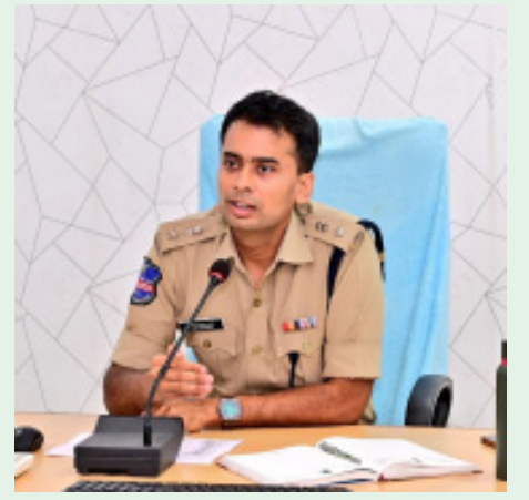
బడులకు వంపాలని తెలియజేయడం జరిగిందని తెలిపారు. ఇతర రాష్ట్రాల వారికి విదతలవారీగా వారి సొంత స్థలాలకు చేర్చి తల్లిదండ్రులకు కుటుంబ సభ్యులకు అందజేయడం జరిగిందని తెలిపారు. చట్ట ప్రకారం నిబంధనలు అతిక్రమించిన వారిపై చర్యలు తీసుకుంటామని హెచ్చరించారు. నెల రోజులపాటు కొనసాగిన ఈ ఆపరేషన్ స్టైల్ తో ఆగకుండా, సంవత్సరం పాటుగా బాల కార్మికుల కనబడినట్లుంటే వెంటనే దయలో 100 ద్వారా తెలియజేయాలని నూచించారు. సమాచారం అందించిన వారి వివరాలను గోప్యంగా ఉంచబడతాయని తెలిపారు.

ఆదిలాబాద్ జిల్లా ఫిబ్రవరి 02(భారత శక్తి) జిల్లాలో బాల కార్మికుల వ్యవస్థను నిర్మూలించడానికి ఆపరేషన్ స్టైల్ పేరుతో జనవరి 1 నుండి 31 వరకు నెలరోజుల పాటు నిర్వహించిన కార్యక్రమంలో జిల్లావ్యాప్తంగా 85 మంది బాలలను రక్షించి తల్లిదండ్రులకు మరియు వసతి గృహాలకు చేర్చి బాల కార్మికుల వ్యవస్థను నాశనం చేయడం జరిగిందని జిల్లా ఎస్పీ అఖిల్ మహాజన్ ఐపిఎస్ ఒక పత్రిక ప్రకటన ద్వారా తెలియజేశారు. అన్ని శాఖల సమన్వయంతో ఆపరేషన్ స్టైల్ ను విజయవంతం చేయడం జరిగిందని తెలిపారు. ఈ ఆపరేషన్ స్టైల్ నందు జిల్లావ్యాప్తంగా 85 మంది పిల్లలను రక్షించినట్లు అందులో 72 మంది పిల్లలను తల్లిదండ్రులకు 13 మంది పిల్లలను వసతి గృహాలకు తరలించి సొంత వారికి అప్పగించినట్లు తెలిపారు. 85 మంది పిల్లలలో 79 మంది బాలురు 06 బాలికలు ఉన్నట్లు తెలిపారు. జిల్లావ్యాప్తంగా 35 కేసులు నమోదు చేసి కఠినంగా వ్యవహరించడం జరుగుతుందని తెలిపారు. ముఖ్యంగా ఇతర రాష్ట్రాల వారు ఇందులో 24 మంది ఉన్నట్లు తెలిపారు. ఆపరేషన్ స్టైల్ లో భాగంగా జిల్లా వెల్ఫేర్ కమిటీ కార్మిక శాఖ, విద్యాశాఖ, చైల్డ్ ప్రొటెక్షన్ యూనిట్, వైద్య శాఖ, మరియు ఎస్పీవోల సహకారంతో జిల్లాలో ఆపరేషన్ స్టైల్ ను విజయవంతం చేసి బాల కార్మికులను గుర్తించి తగు చర్యలను తీసుకోవడం జరిగింది. ముఖ్యంగా రెస్ట్రాన్ చేసిన వారిలో హోటల్లో, భవన నిర్మాణాల్లో, ఇటుక బట్టిలో పనులలో ఉన్న పిల్లలను గుర్తించి తల్లిదండ్రులకు అందజేసి అవగాహన కల్పించడం జరిగిందని బాలలను