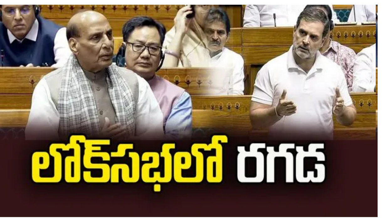
లోక్ సభలో రగడ