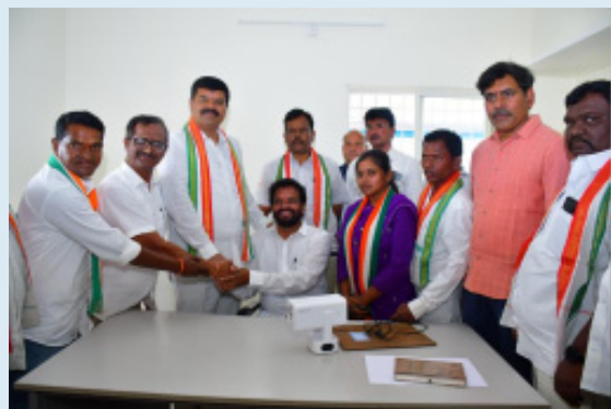
మణుగూరు, ఫిబ్రవరి 02 (భారతశక్తి): ప్రజా పాలనలో గ్రామీణ ప్రాంతాల అభివృద్ధి లక్ష్యమని పిన్ పాక నియోజకవర్గ

-విద్యుత్ శాఖ అభివృద్ధిలో మరో కీలక ఘట్టం -ఎలక్ట్రికల్ ఏడి కార్యాలయ నూతనభవనాన్ని ప్రారంభించిన ఎమ్మెల్యే పాయం