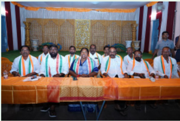
ఈసారి ట్రాఫిక్ సమస్యలు చాలా వరకు తగ్గయిన పేర్కొన్నారు. కొంతమంది వివిధ వందలాది మందితో, అనేక వాహనాలతో రావడం వల్లే ఇబ్బందులు తలెత్తాయన్నారు.

ములుగు జిల్లా ప్రతినిధి, ఫిబ్రవరి 02 (భారత శక్తి): ప్రపంచ ప్రఖ్యాతి చెందిన మేడారం సమృద్ధి-సారలమ్మ మహాజాతర ప్రతిష్ఠను దెబ్బతీసేలా కావాలనే కొంతమంది రాజకీయ పార్టీలు, కొన్ని మీడియా సంస్థలు, కొందరు స్వాములు తప్పుడు ప్రచారాలకు పాల్పడుతున్నారని పంచాయతీరాజ్ గ్రామీణ అభివృద్ధి స్త్రీ-శిశు సంక్షేమ శాఖ మంత్రి సీతక్క ఆగ్రహం వ్యక్తం చేశారు. ములుగు జిల్లా కేంద్రంలోని డిఎల్ఆర్ ఫంక్షన్ హాల్ లో శుక్రవారం ఏర్పాటుచేసిన మీడియాసమావేశంలో ఆమె మాట్లాడారు. మేడారం జాతర నిర్వహణలో భాగంగా వారం రోజుల పాటు తాము 24 గంటలూ అక్కడే ఉండి పనిచేశామని, కోట్లాది మంది భక్తులు సుఖశాంతలతో దర్శనం చేసుకున్నారని తెలిపారు. జాతరను సక్సెస్ చేయడంలో సహకరించిన ములుగు జిల్లా మీడియా సోదరులకు, అధికారులు, పోలీసులు, పారిశుధ్య సిబ్బందికి మంత్రి కృతజ్ఞతలు తెలిపారు. గుడి నిర్మాణం ప్రారంభమైన నాటి నుంచే ఆదివాసీ విశ్వాసాలకు వ్యతిరేకమని తప్పుడు ప్రచారాలు సాగుతున్నాయని పేర్కొన్నారు. గుడిలో చేసిన ప్రతి మార్పు పూజారుల ఆమోదం, ఎండోమెంట్ కమిషనర్ అనుమతితోనే జరిగిందని స్పష్టం చేశారు. అయినప్పటికీ సమృద్ధి గడ్డల వద్ద కూడా రాజకీయాల చేయడం దురదృష్టకరమన్నారు. శుక్రవారం సాయంత్రం వివిధ వాహనాలు భారీగా రావడంతో కొంత సేపు ట్రాఫిక్ ఇబ్బంది ఏర్పడిందని, అది బస్సులు లేకపోవడం వల్ల కాదని తెలిపారు. గత జాతరలతో పోలిస్తే