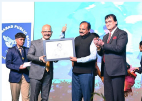
తరగతి గదుల్లో ప్రత్యేకంగా ఏర్పాటు చేసిన ఆధునిక స్మార్ట్ ప్యానల్స్ ను ప్రారంభించారు.

కడప నగరంలోని “ది హైదరాబాద్ పబ్లిక్ స్కూల్” లో నిర్వహించిన 2025--26 విద్యాసంవత్సర వార్షికోత్సవ వేడుక అంగరంగ వైభవంగా, కన్నుల పండుగా సాగింది.